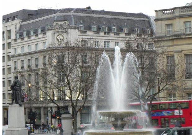
בכיכר טרפלגר (Trafalgar Square)