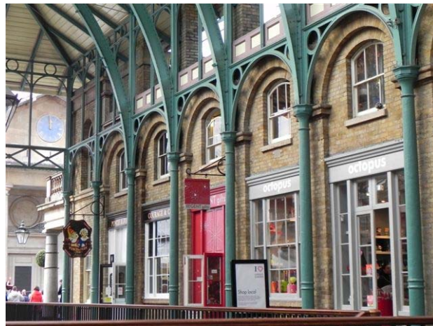
בקובנט גרדן (Covent Garden)