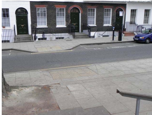
מדרכות והנמכת מדרכה עם משטח אזהרה במעבר חציה

המדרכות עשויות לרוב מרצפות בטון גדולות. חלקן חודשו בשנים האחרונות, משטח ההליכה אחיד ואין כמעט שקעים ובלטות בדרך. כמעט בכל מקום יש הנמכות מדרכה. ברוב הנמכות המדרכה יש גבשושיות של משטחי אזהרה מישושיים. הגבשושיות די שטוחות (גובהן 2-4 מ"מ) בקוטר גדול יחסית, ומכיוון שהמשטח העליון שלהן שטוח והן מסודרות ברווחים גדולים זו מזו אפשר להסתדר (בעזרת מלווה), למרות שהם מקשים על הניידות בכיסא גלגלים בעיקר בעליה על המדרכה לאחר חציית הכביש. קפיצות כיסא הגלגלים על גבי הגבשושיות גורמות ללא מעט כאבי גב. עוברי אורח שהשתמשו במקל הליכה (בעיקר קשישים) התקשו מאד בהליכה על גבי משטחי האזהרה. כדי לעבור את הכביש הם המתינו לרוב מאחורי המשטח עם הבליטות ולא הספיקו לעבור את הכביש עד להחלפת האור הירוק ברמזור.