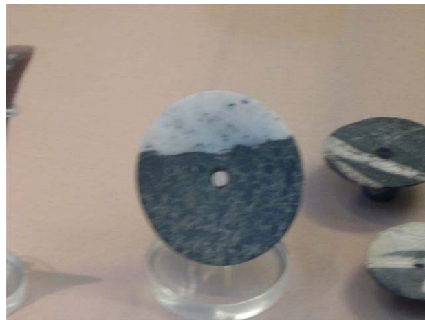
CD עתיק מאבן במוזיאון הבריטי