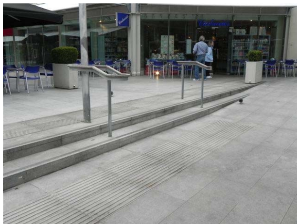
שיפוע מתון משולב במדרגות באחת היציאות לרחוב מקניון פתוח בלונדון- Bloomsbury