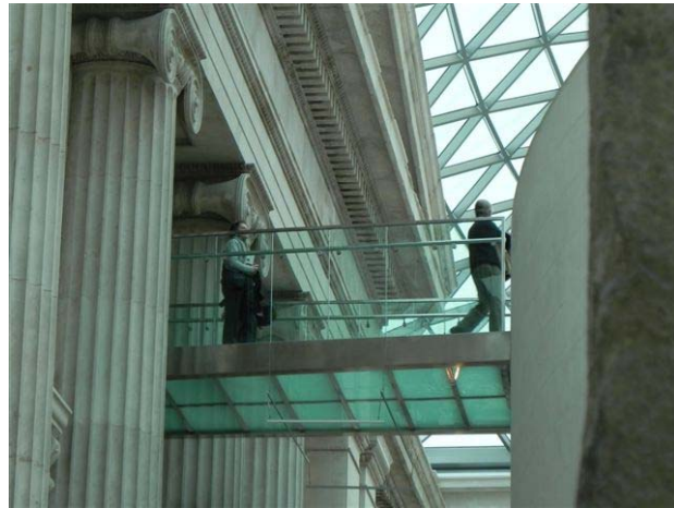
תקרות וגשר בין חלקי המוזיאון באולם הכניסה הראשי למוזיאון הבריטי