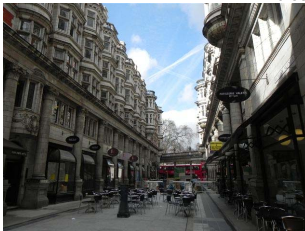
רחוב יפה בדרך

מהמלון בבלומסבורי לקובנט גרדן (Covent Garden) ומשם עד כיכר טרפלגר (Trafalgar Square). בכנסיית St. Martin in the Fields שבככר טרפלגר יש קונצרטים כמעט בכל ערב. רכשנו כרטיסים במקום לקונצרט מוזיקת ברוק עם תזמורת קמרית ומקהלה. מקום הישיבה לכיסא הגלגלים היה לפני השורה הראשונה של כסאות העץ הקבועים בכנסייה, ממש בתוך התזמורת. בתוכנית יצירות של באך, הנדל, ויולדי (קונצרט לחליל פיקולו), פרסל ועוד. המקהלה של בני נוער ובתוכה כמה זמרים סולנים ממש טובים הייתה מעולה, ובאקוסטיקה של הכנסייה החוויה הייתה פשוט מדהימה.