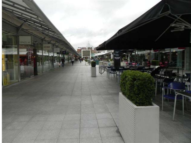
יום מעונן ללא גשם בקניון פתוח בלונדון-Bloomsbury

סמוך למלון מרכז קניות קטן, עם סופרמרקט, חנויות אחדות, בית קולנוע וכמה מסעדות. הכל נגיש. ביום חמישי יש שוק אוכל ברחבה הפתוחה במרכז הקניות, חגיגה נחמדה.