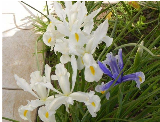
פריחת האירוסים בגינה שלנו, מרץ 2011